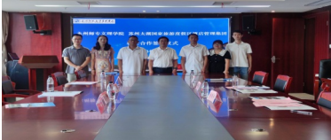
苏州太湖国家旅游度假区酒店管理集团 校企合作签订2