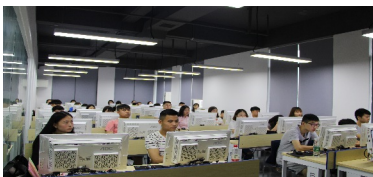
湖南厚溥数字科技有限公司长沙中电软件园 校企合作基地2