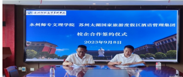
苏州太湖国家旅游度假区酒店管理集团 校企合作签订1