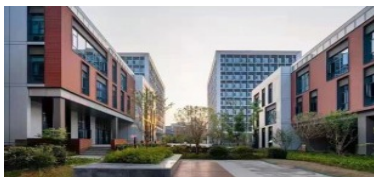
湖南厚溥数字科技有限公司长沙中电软件园 校企合作基地1